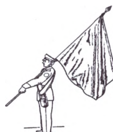
Рис. 62. Положение Боевого знамени «на плечо»